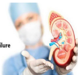
Acute kidney failure